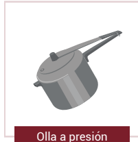
Olla a presión